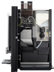
OPTIBEAN 2 (XL) TOUCH