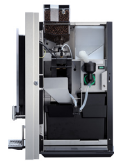
OPTIBEAN 2 (XL)