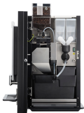
OPTIBEAN 3 (XL) TOUCH