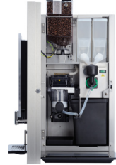
OPTIBEAN 3 (XL)